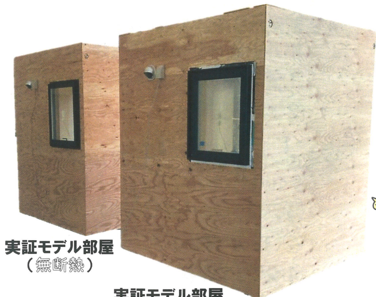
実証モデル部屋 (無断熱)