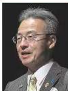
杉本 達治氏 福井県知事

今回の新幹線延伸に、磨き上げる必要がある。福井が、若狭、地酒といった歴史ある観光資源を、時間的距離の短縮によって、より身近に感じられるようになる。福井県は、観光資源を磨き上げることで、観光客の滞在時間を長くし、消費を促す。また、観光客の滞在時間を長くし、消費を促す。また、観光客の滞在時間を長くし、消費を促す。