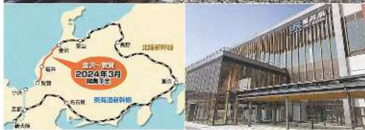
新幹線の乗り入れに合わせ、新しい駅舎の建築工事が進む