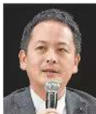
山浦 光一郎氏 福井県議会議員