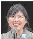
鷺頭 美央氏 福井県知事

北陸新幹線延伸で、北陸全体の観光客が増える。福井県は、観光客の受け皿として、観光客の滞在時間を長くし、消費を促す。また、観光客の滞在時間を長くし、消費を促す。また、観光客の滞在時間を長くし、消費を促す。